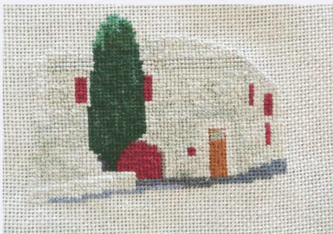
La maison au cyprès