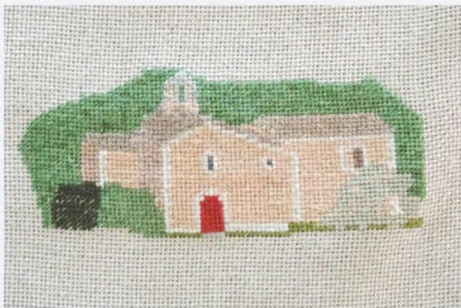
Notre Dame de Salut