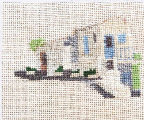
Dans la grand'rue