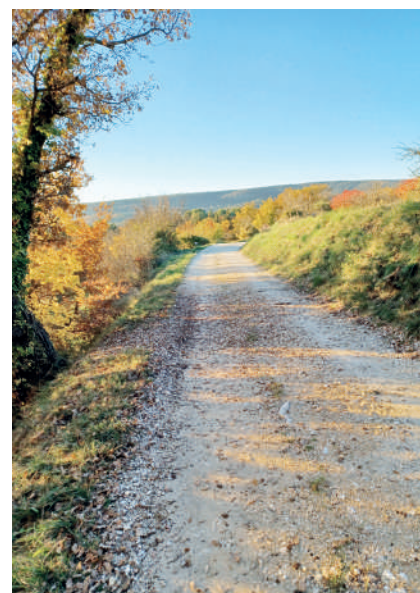
Rénovation Chemin de Venasque